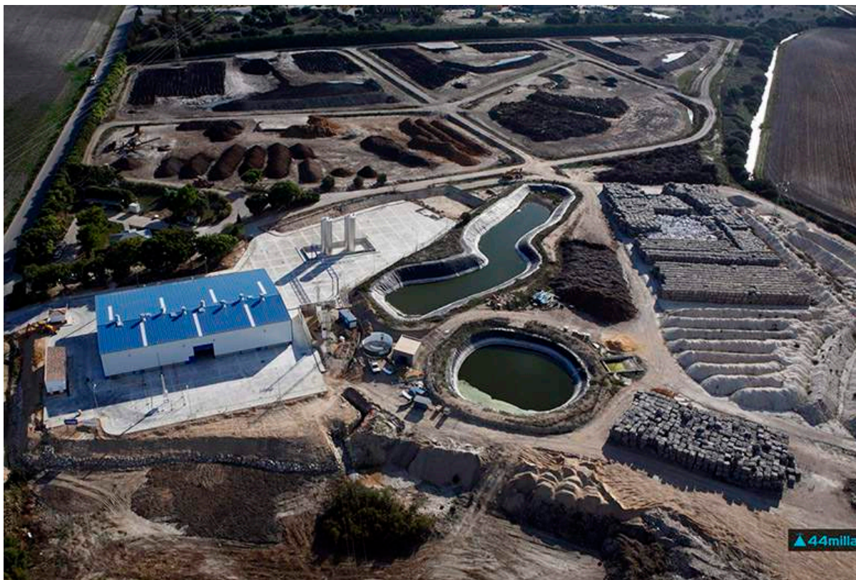
Cassandra Oils pilotanläggning i Spanien.